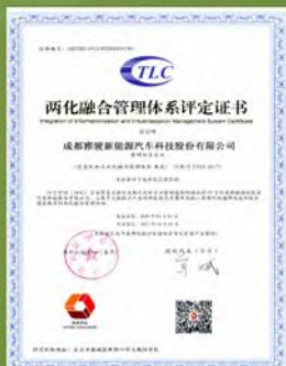
两化融合管理体系评定证书