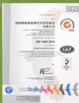
ISO 14001” 认证