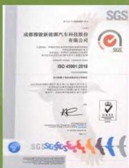
ISO 45001” 认证