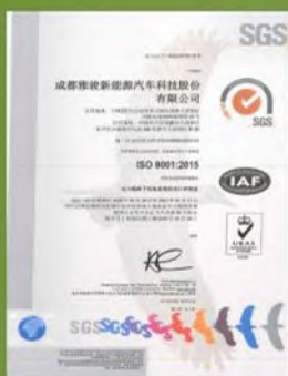
ISO 9001” 认证