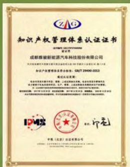
知识产权管理体系认证证书