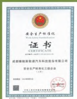
安全生产标准化认证证书